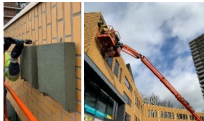
Deze tijdelijke vleermuiskast was in gebruik genomen, zichtbaar vanwege de uitwerpselen. Voordat tijdelijke kasten eraf gehaald mogen worden, moet zeker zijn dat er geen vleermuizen in de kast zitten.

U heeft ze vast wel eens zien hangen: een vrij grote platte kast aan gebouwen of aan bomen. Dit zijn vleermuiskasten. In iedere stad, maar ook daarbuiten komen vleermuizen voor. Alle vleermuizen in Nederland zijn beschermd en vallen onder de Wet Natuurbescherming. Bepaalde vleermuissoorten verblijven graag in gebouwen. Door renovatie of opnieuw bouwen van gebouwen, verdwijnen er verblijfplaatsen van vleermuizen.